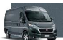
Lanzarote Grey (385)