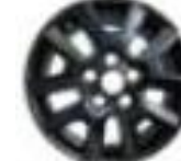
Lengvojo lydinio ratlankiai