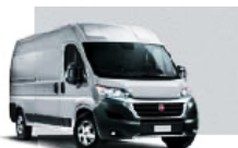
Expedition Grey (676)