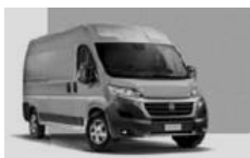
Artense Grey (113)