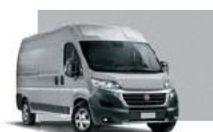
Aluminium Grey (611)