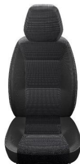
Pilkos spalvos „Velvet“ su dvigubomis siūlėmis OPT.8RT (165)

UAB „AUTOBRAVA“, oficialus FIAT PROFESSIONAL automobilių importuotojas Lietuvoje FIAT PROFESSIONAL automobilių pardavimo salonai: