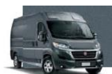
Iron Grey (691)