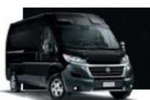
Metallic Black (632)