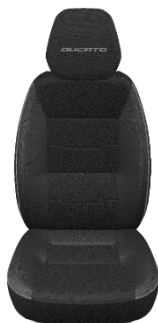
Juodos spalvos „Crepe“ su dvigubomis siūlėmis OPT.8RS (076)