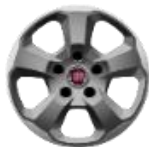
Lengvojo lydinio ratlankiai