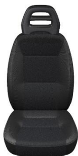
Juodos spalvos „Crepe“ OPT.4MZ (173)